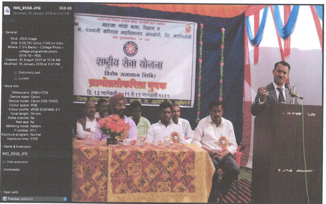
Glimpses of valedictory function of NSS Camp at Kasvi